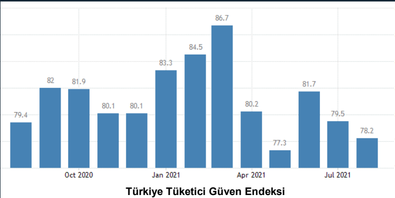
Türkiye Tüketici Güven Endeksi