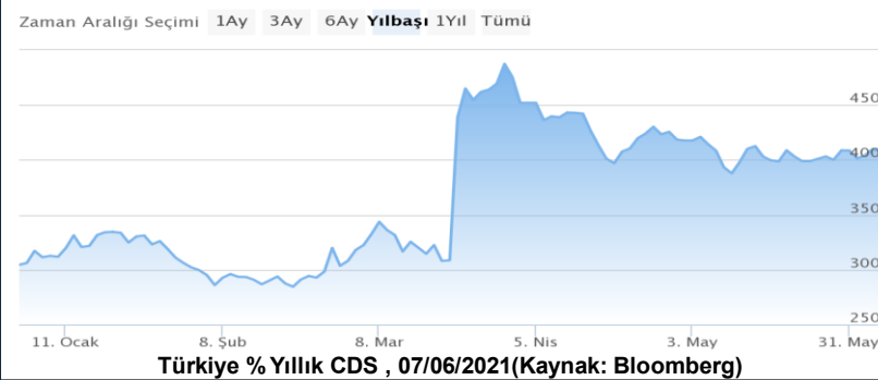
Türkiye % Yıllık CDS , 07/06/2021

• Dolar/TL; Doların küresel piyasalardaki güçsüz seyrine rağmen haftaya 8,66 seviyesinde başladı.