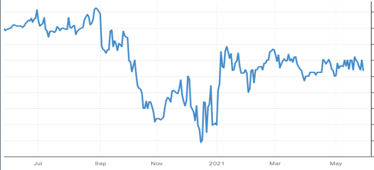
Almanya 12 Aylık Bono