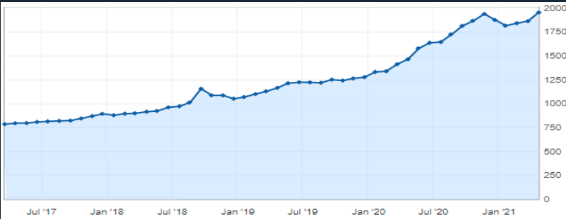
Merkezi Hükümet Borç Stoku; Mart