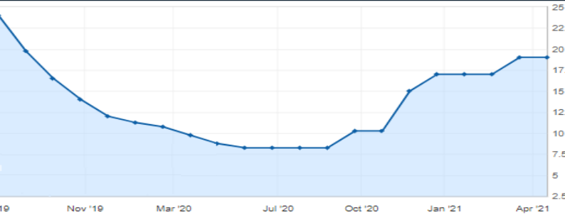
Politika Faiz Oranı, Nisan 2021

• Dolar/TL, gün içinde %0,04 değer kaybederek 8,05 seviyelerindeki yatay seyrine devam ediyor. TCMB'nin politika faiz oranlarını sabit tutması sonucu dolarda hareket sınırlı artış olarak gerçekleşti.