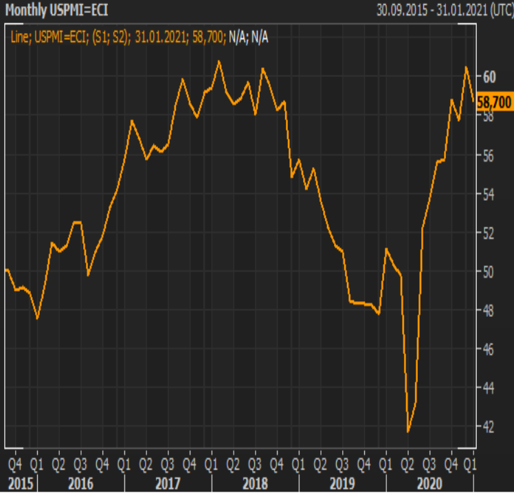
ABD'de PMI 58,7'ye geriledi.