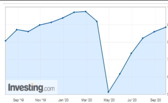
Türkiye Ekonomik güven endeksi, eylülde aylık bazda yüzde 3,1 artarak 88,5 değerine yükseldi.