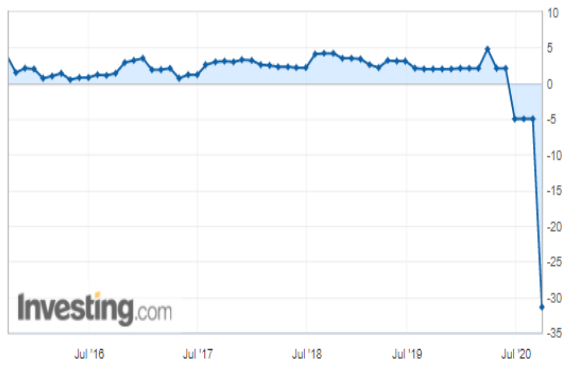
ABD ekonomisi 2. çeyrekte yıllıklandırılmış rakamla yüzde 31.4 daraldı.