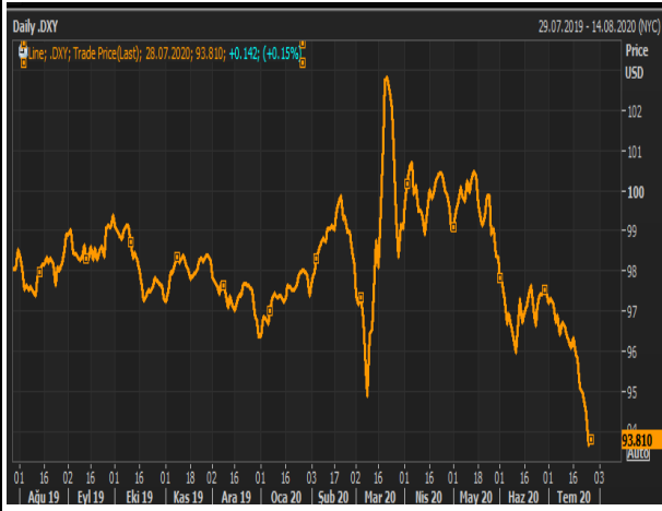
Dolar Endeksi 1 yıllık Grafik